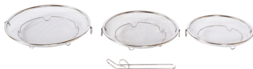
すっきり暮らす盆ざる 19・22・25cm 持ち上げフック付き