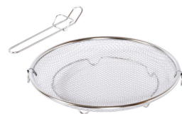
すっきり暮らす盆ざる 25cm 持ち上げフック付き