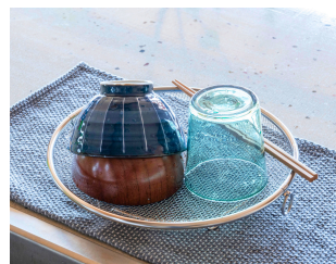
野菜や食器の水切り