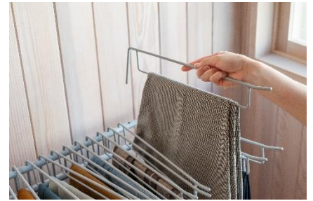
取り外し可能で収納しやすい