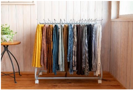
掛けるだけで畳みシワを軽減