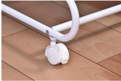
キャスター付きで簡単移動