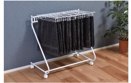
ボトムス以外の収納・物干しに