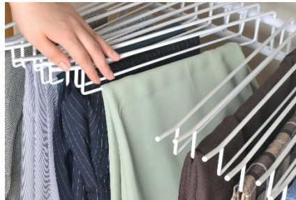
スイング式で使いやすいハンガー