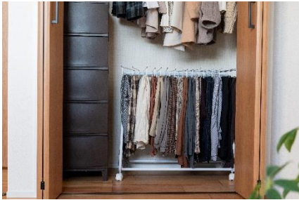
クローゼットや押し入れに