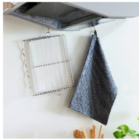
引っ掛け収納可能