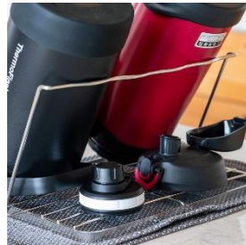
奥にキャップを置ける