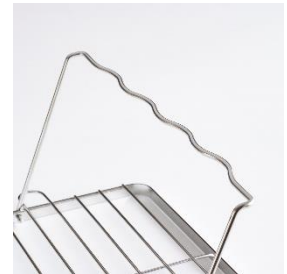
2L 水筒にフィットする 波型のワイヤー