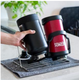
重たい水筒でも安心な 耐荷重約 5kg