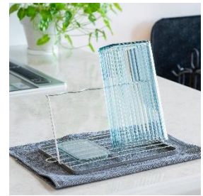
ピッチャーやフライパン など様々な水切りに