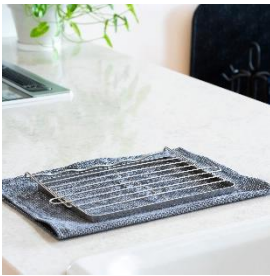
使わない時は 折りたためる