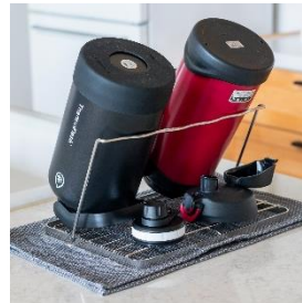
2L 水筒に合わせた高さの 背もたれワイヤー