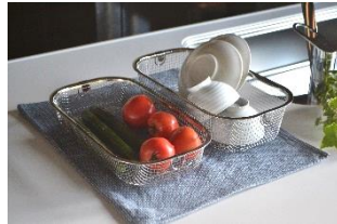
すっきり暮らす水切りかご 浅型/深型 3,190 円/3,630 円 (税込み)