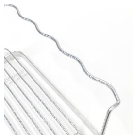
安定して立て掛けられる 波々ワイヤー