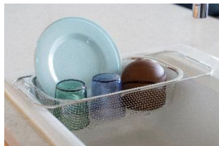
すっきり暮らす水切りかご深型 シンク渡しタイプ 5,390 円 (税込み)