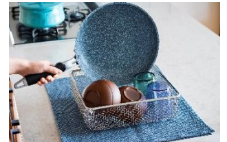
すっきり暮らす水切りかご スクエアタイプ 4,950 円 (税込み)