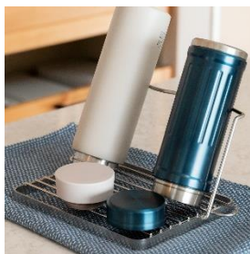
手前にキャップを置ける