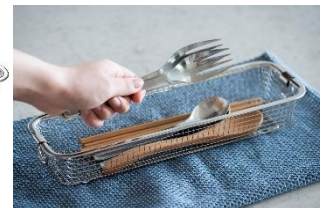
すっきり暮らす水切りかご スリムタイプ 2,420 円 (税込み)