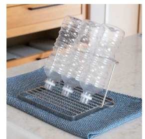
洗ったペットボトルや ツールにも