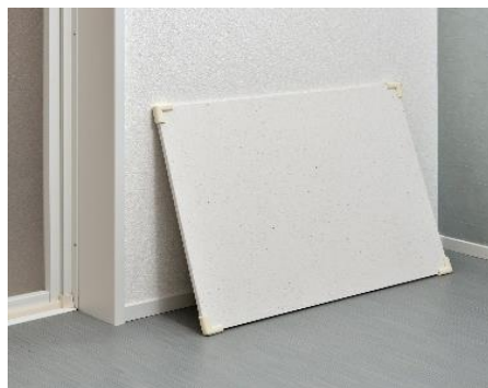
▲立てかけて乾かす際も床を傷つけないので安心

《本リリースに関するお問い合わせ》御興味ございましたら、お気軽にお問い合わせくださいませ。