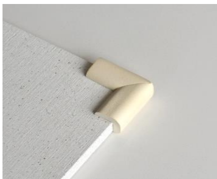
▲角割れを防ぐコーナークッション

水を吸収して乾かす珪藻土バスマットは今ではお馴染みのものとなっていますが、「KAWAKI」のバスマットは4隅にコーナークッションを付け、角を保護することで割れやすさを解消しました。立てかけて乾かす際など、床や壁を傷つけません。また、素足で乗る際、角に足をぶつけてしまうなどのケガ防止にもなります。